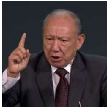
Gambar 2. Pdt Stephen Tong.

Pdt. Stephen Tong lahir di Indonesia dan sejak kecil telah menunjukkan bakat luar biasa dalam bidang musik dan teologi. Ia memiliki pemahaman mendalam tentang musik klasik dan sering menggunakannya dalam pelayanan gereja. Sejak usia muda, ia sudah mulai memainkan berbagai alat musik, termasuk piano dan biola, serta mendalami teori musik secara mandiri dan melalui pendidikan formal. Pendidikan dan pengalamannya di bidang musik semakin memperkuat perannya sebagai seorang hamba Tuhan yang memanfaatkan musik untuk menyampaikan Injil 1 .